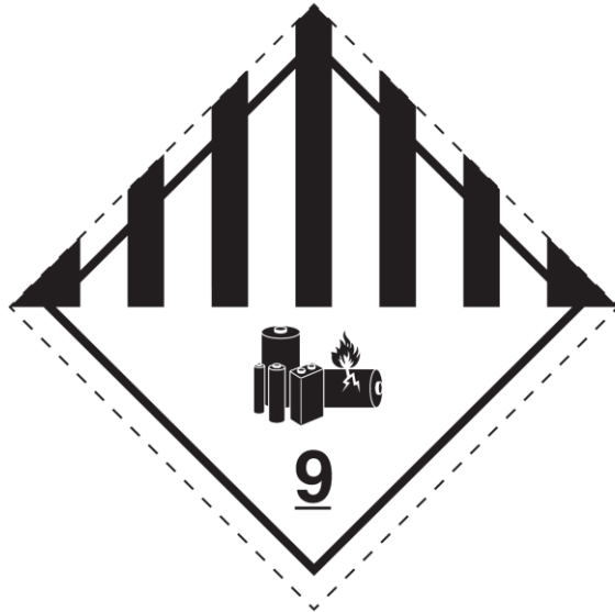
図7.3.X 第9分類-リチウム電池